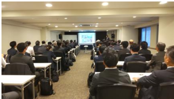
プレゼンテーション

参加者 【一部】プレゼンテーション 60名(正会員18社29名、賛助会員15社31名) 【二部】懇親会 40名(正会員12社17名、賛助会員13社23名)