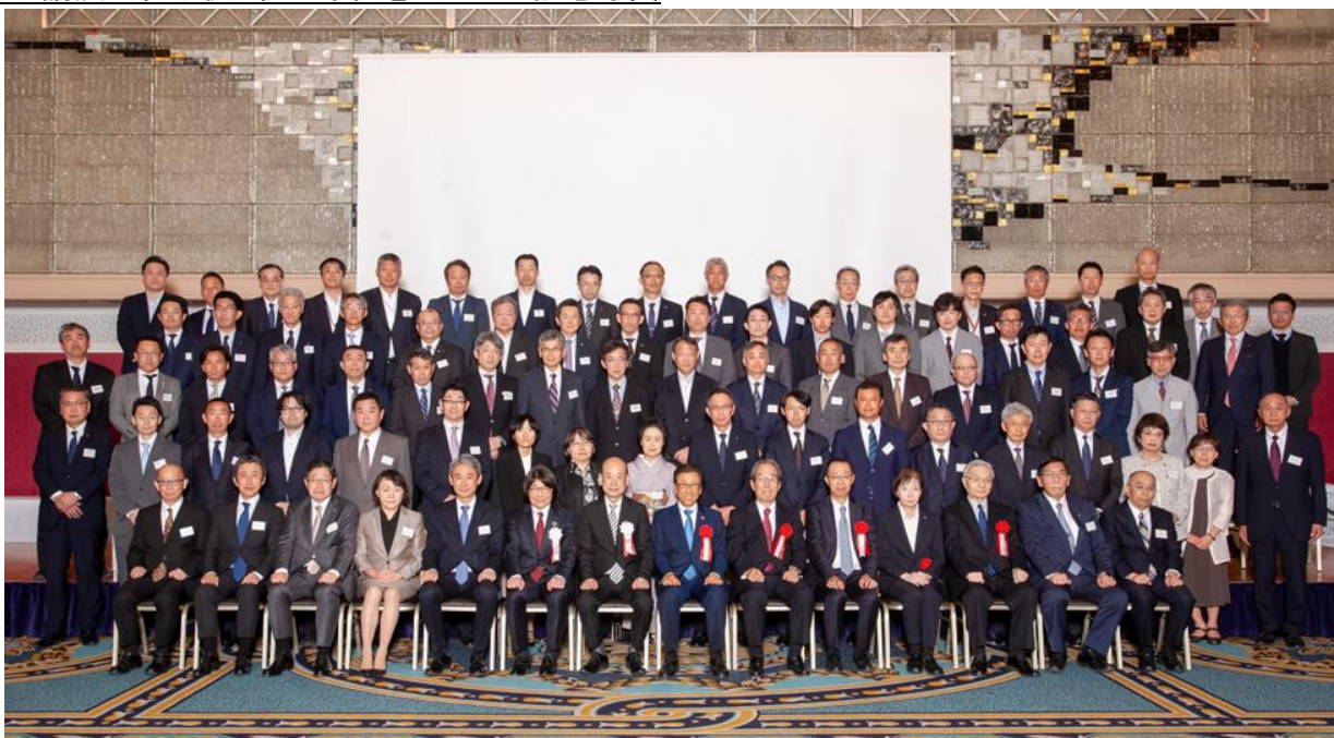
一般社団法人 北海道ビルヂング協会 70周年記念祝賀会 令和7年5月23日 於 ニューオータニイン札幌